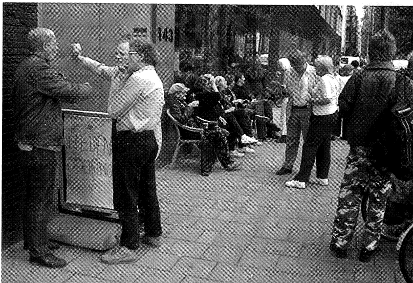
De Vrijplaats bracht ook leven in de Sarphatistraat

Sinds de opening exposeerden maar liefst 220 kunstenaars en waren er 60 feestelijke openingen! Een heel kleine greep uit een lange reeks: September 2004, TPG post, met 20 postbodes, die hun vrijetijdsaspiraties exposeerden, waarvan de opbrengst van maar liefst